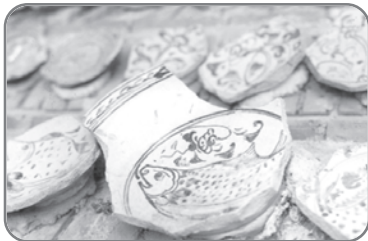
เครื่องสังคโลก