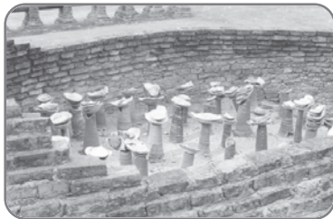
เตาเผาทุเรียน

ภาพนี้สะท้อนถึงวิถีชีวิตและการปกครองอาชีพของชาวสุโขทัยดังนี้